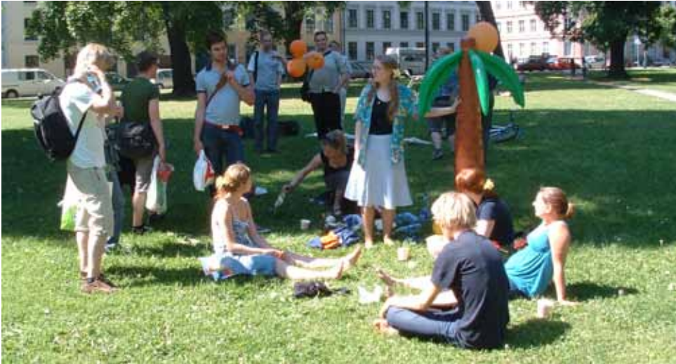
Fra lanseringa av Tax Justice Network Norden i 2006, med oppblåsbar palme og Attac-ballonger.

Attac har jobbet mot skatteparadis siden starten, og Attac har vært initiativtager for nettverksorganisasjonen Tax Justice Network både internasjonalt, på nordisk nivå og her i Norge. Gjennom vårt og TJNs arbeid har stadig flere sett hvor alvorlig en trussel skatteparadisene er mot en sunn økonomi, og det er i dag et problem som blir tatt seriøst på alle nivåer.